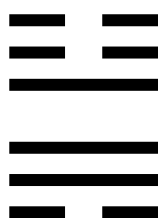
Lôi - Phong HẰNG TRÙNG CỬU