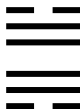
Trạch - Phong ĐẠI QUÁ CẢ QUÁ

Việc cũ, xưa bị và được cắt bỏ (nếu trái với Chân - Thiện - Mỹ)