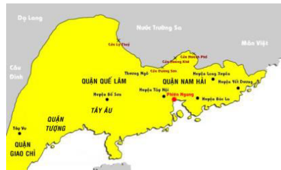
Nước Nam Việt 179 TCN

Sau khi Tần Thủy Hoàng thống nhất 6 nước Hàn, Triệu, Ngụy, Sở, Yên, Tề, ông ta bắt đầu tiến đánh Bách Việt ở phía nam. Năm 218 TCN sai tướng Đồ Thư với 500.000 quân Tần chia làm 5 đạo tấn công các bộ lạc Bách Việt ở vùng đất Lĩnh Nam trong đó có Âu Lạc, Thục Phán An Dương Vương đã lãnh đạo thành công cuộc chiến 10 năm (218-207 TCN) bảo vệ lãnh thổ Âu Lạc độc lập tới năm 180 TCN; sau đó bị mất nước vào tay Triệu Đà năm 179 TCN.