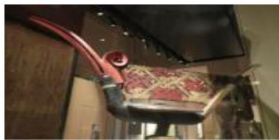
Chim cắt hồng hoàng Kenyalang của người Iban, Sarawak triển lãm tại Bảo Tàng Viện Văn Minh Á châu Singapore.

Hai Bà Trưng là con cháu, dòng dõi vua Hùng Vương đóng đô ở Mê Linh đất Phong châu ( tên loại chim Mlang, Mling, Langling trong tiếng Việt mừng... ) Ý nghĩa là Đất Mê Linh biểu tượng về Loài chim là Dòng dõi Hùng Vương ( Hùng là con chim đực, là thần mặt trời )